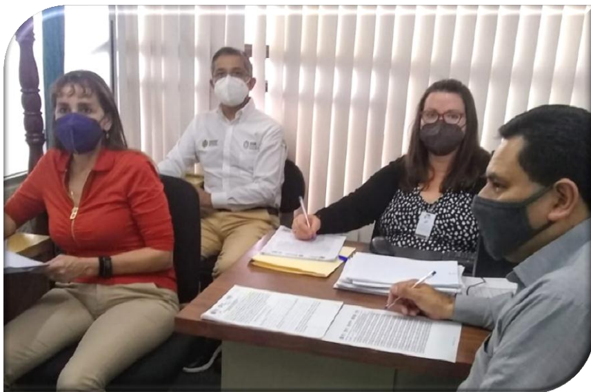
DEPENDENCIA O ENTIDAD: SECRETARÍA DE FINANZAS Y PLANEACIÓN