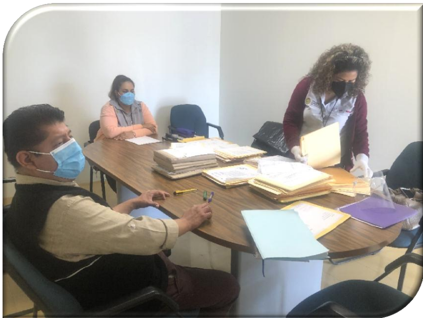
DEPENDENCIA O ENTIDAD: SECRETARÍA DE SALUD