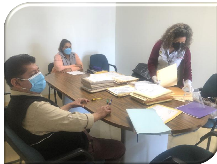
DEPENDENCIA O ENTIDAD: SECRETARÍA DE SALUD