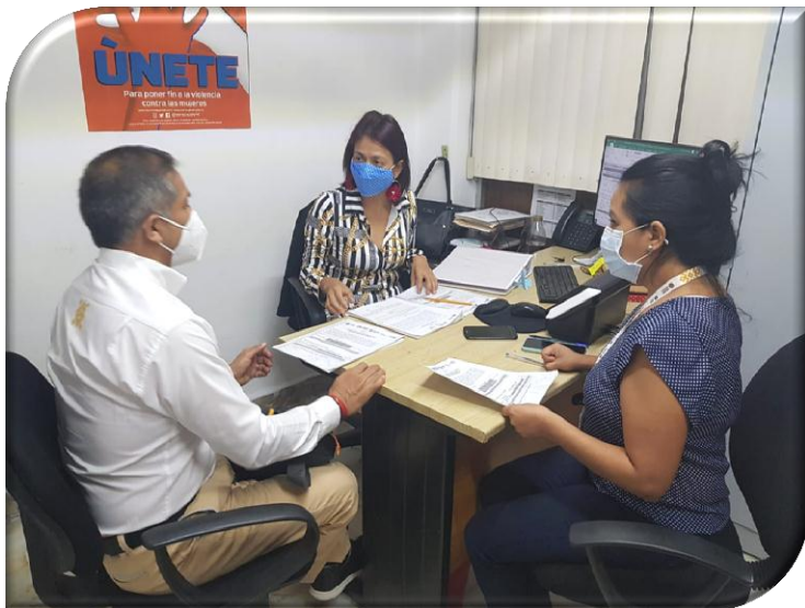
DEPENDENCIA O ENTIDAD: INSTITUTO VERACRUZANO DE LAS MUJERES