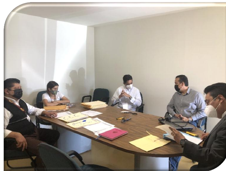
DEPENDENCIA O ENTIDAD: SECRETARÍA DE DESARROLLO AGROPECUARIO, RURAL Y PESCA