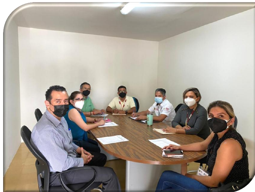
DEPENDENCIA O ENTIDAD: SECRETARÍA DE SEGURIDAD PÚBLICA