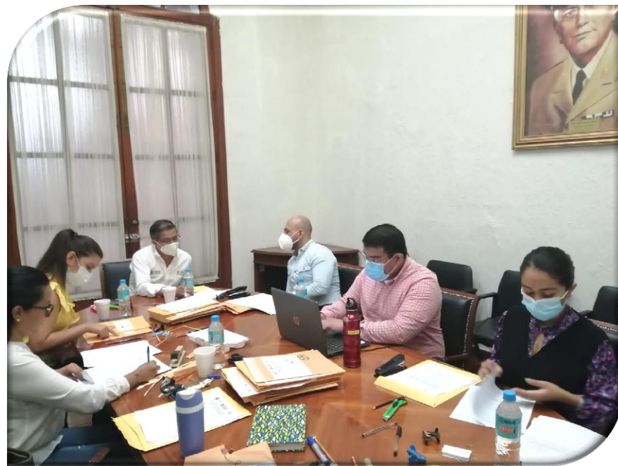
DEPENDENCIA O ENTIDAD: SECRETARÍA DE GOBIERNO