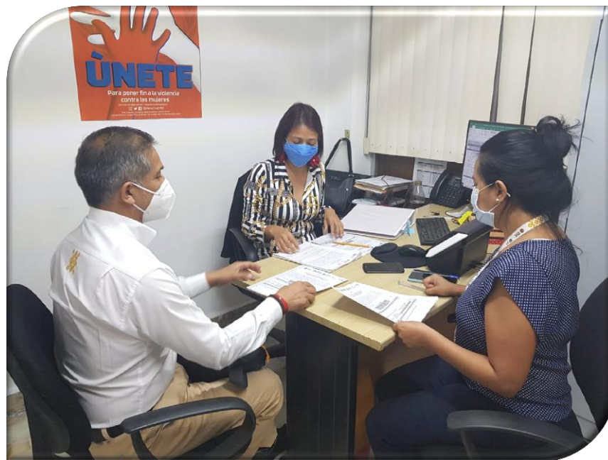
DEPENDENCIA O ENTIDAD: INSTITUTO VERACRUZANO DE LAS MUJERES