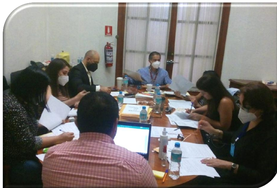
DEPENDENCIA O ENTIDAD: SECRETARÍA DE GOBIERNO