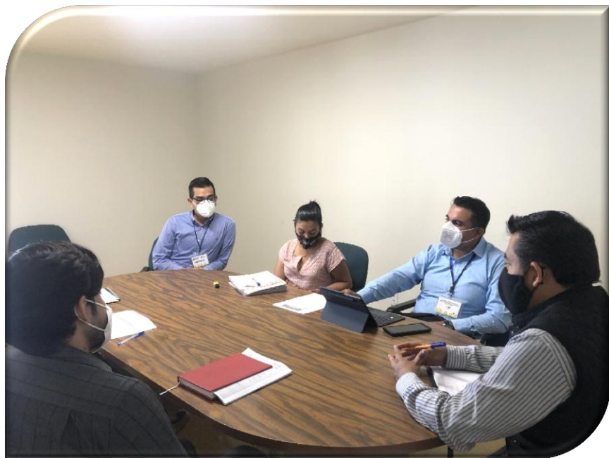
DEPENDENCIA O ENTIDAD: SECRETARÍA DE EDUCACIÓN