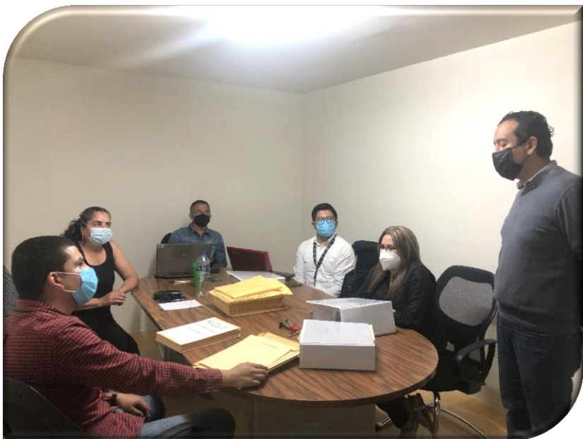
DEPENDENCIA O ENTIDAD: DESARROLLO INTEGRAL DE LA FAMILIA