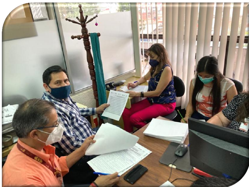
DEPENDENCIA O ENTIDAD: SECRETARÍA DE FINANZAS Y PLANEACIÓN