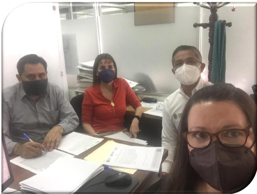
DEPENDENCIA O ENTIDAD: SECRETARÍA DE FINANZAS Y PLANEACIÓN