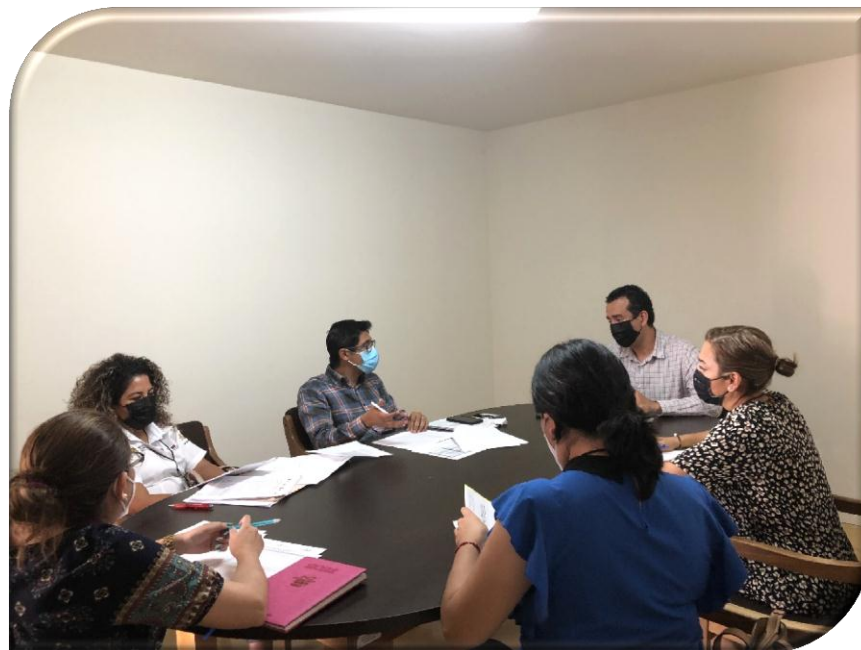
DEPENDENCIA O ENTIDAD: SECRETARÍA DE SALUD