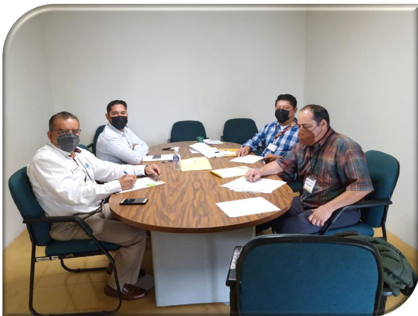
DEPENDENCIA O ENTIDAD: COMISIÓN DEL AGUA DEL ESTADO DE VERACRUZ